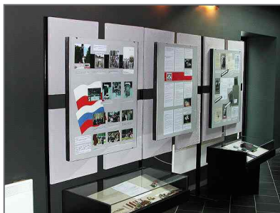
Материалы акции «Живая память»

Проект «Галерея История судьбы» предполагал проведение сменных выставок, посвященных судьбе отдельного человека или истории одной семьи, пострадавших от политических репрессий в СССР. Целью проекта явились показ и осознание истории политических репрес-