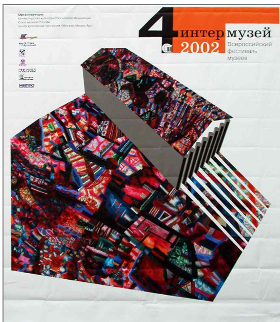
Рекламная афиша Всероссийского фестиваля «Интермузей 2002»