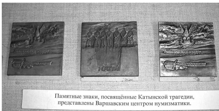
Памятные знаки, посвящённые Катынской трагедии, представлены Варшавским центром нумизматики.

Вторая бронзовая настольная медаль, Ø 70 мм (рис.2). На одной стороне, в центре, изображена икона Богоматерь с младенцем. Эта сторона медали несет на себе названия тех мест, где произошла трагедия 1940 года. Свидетельством этому, круговая надпись на польском языке: