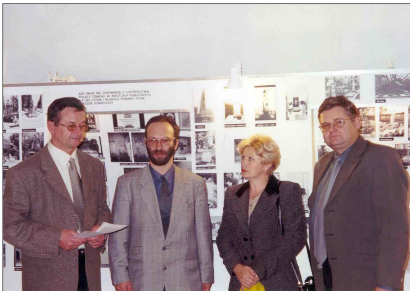
Посещение Катынского музея в Варшаве сотрудниками ГМК «Катынь».

стреляны. Расстреляны тайно, без суда и следствия. Германия объявила виновным Советский Союз, а Советский Союз - Германию.