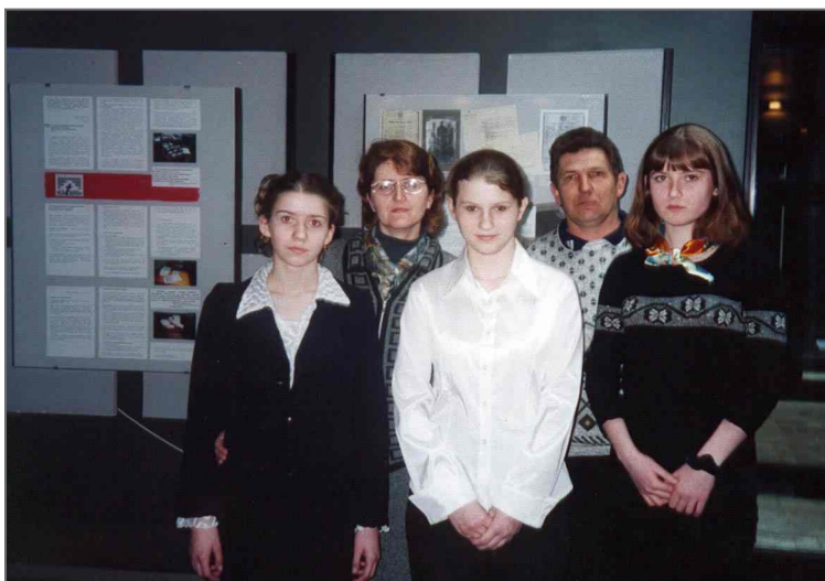
Участники конкурса «Возвращая из забвения»

Авторы работ попытались разобраться, почему происходили репрессии, привели данные о жизни многих людей. Были названы причины репрессий на Смоленщине и в других областях России. Например, как кулаки подверглись репрессиям 6 человек. За работу во время войны на немцев были приговорены к лагерям 3, за шпионаж осуждено 2 человека, за членство в контрреволюционных группах - 2 человека. За каждой сухой цифрой статистических сведений стоит написанная с большим чувством сопереживания информация о пострадавших от политических репрессий в эпоху тоталитаризма.