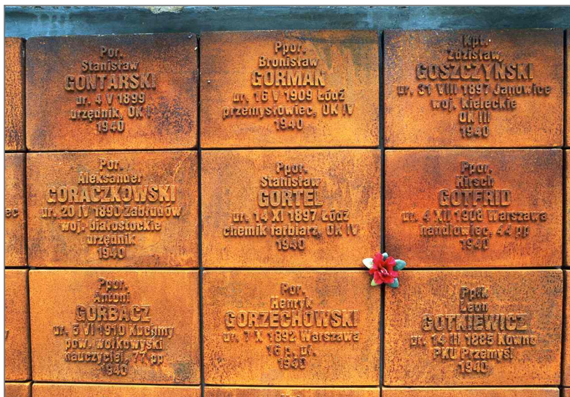
Именные таблички расстрелянных польских офицеров.