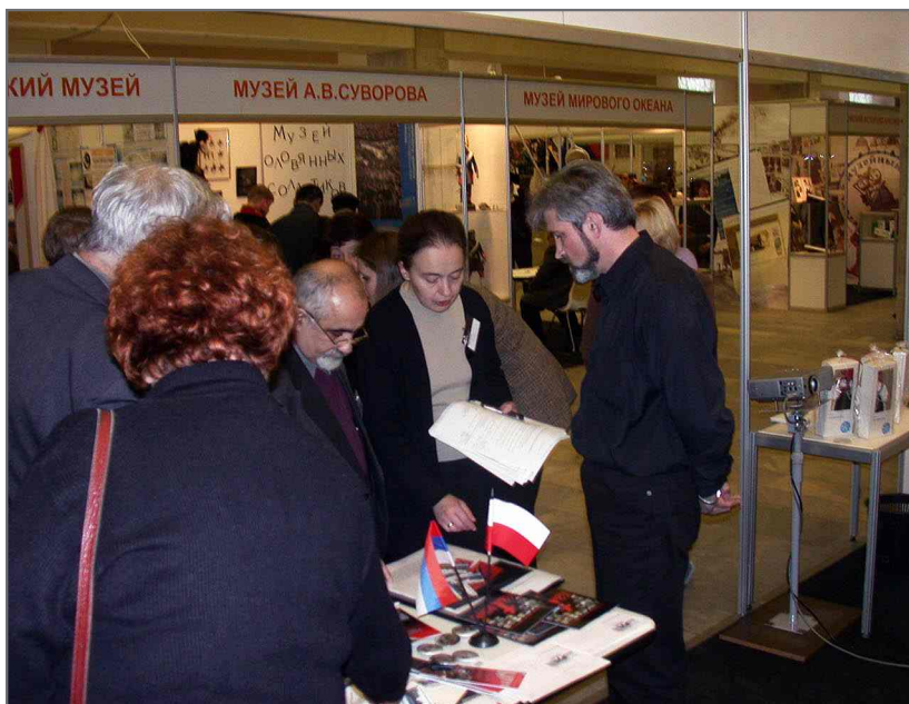
Жюри за работой...

Удачно, учитывая внимание жюри, выступил мемориал в конкурсе номинаций: «Музей в 3-м тысячелетии» (новые формы социальной деятельности) и «Реклама – двигатель музейного прогресса». В первой вышеприведенной номинации было рассказано о программе «Живая память» с демонстрацией материалов и документов, во второй были продемонстрированы несколько видов буклетов, визитки, почтовые конверты, рекламные листы, сайт и фильм «Время осмысления истории».