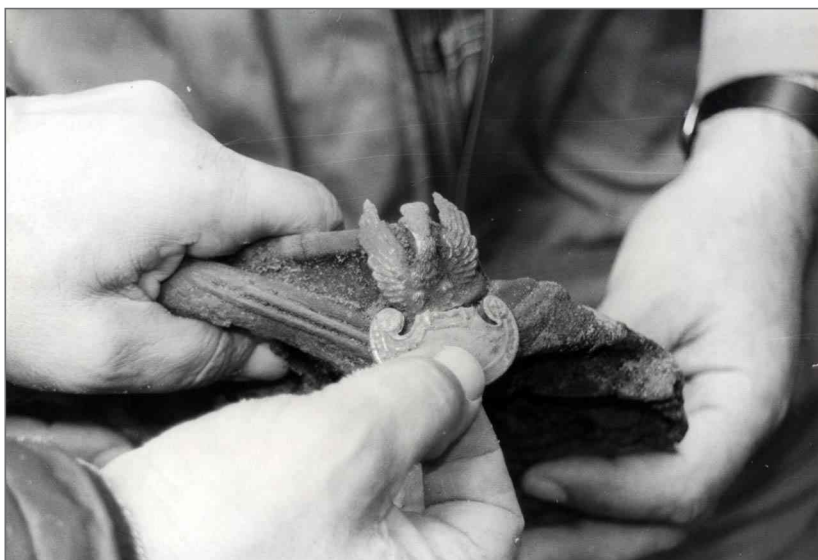
Головной убор польского офицера, найденный при раскопках.