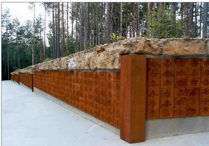
Стена памяти польских офицеров.